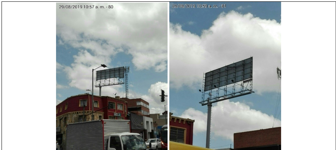
Foto No.1: Vista panorámica del predio, de la estructura y del tablero (otra cara - orientación N-S) de la valla, ubicada en la Calle 69A No. 14-11 (dirección catastral) y/o Calle 70 No. 14-09/11.