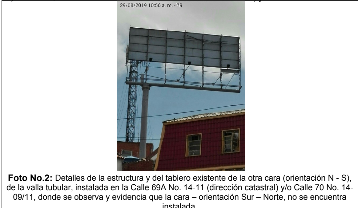
Foto No.2: Detalles de la estructura y del tablero existente de la otra cara (orientación N - S), de la valla tubular, instalada en la Calle 69A No. 14-11 (dirección catastral) y/o Calle 70 No. 14-09/11, donde se observa y evidencia que la cara – orientación Sur – Norte, no se encuentra instalada.